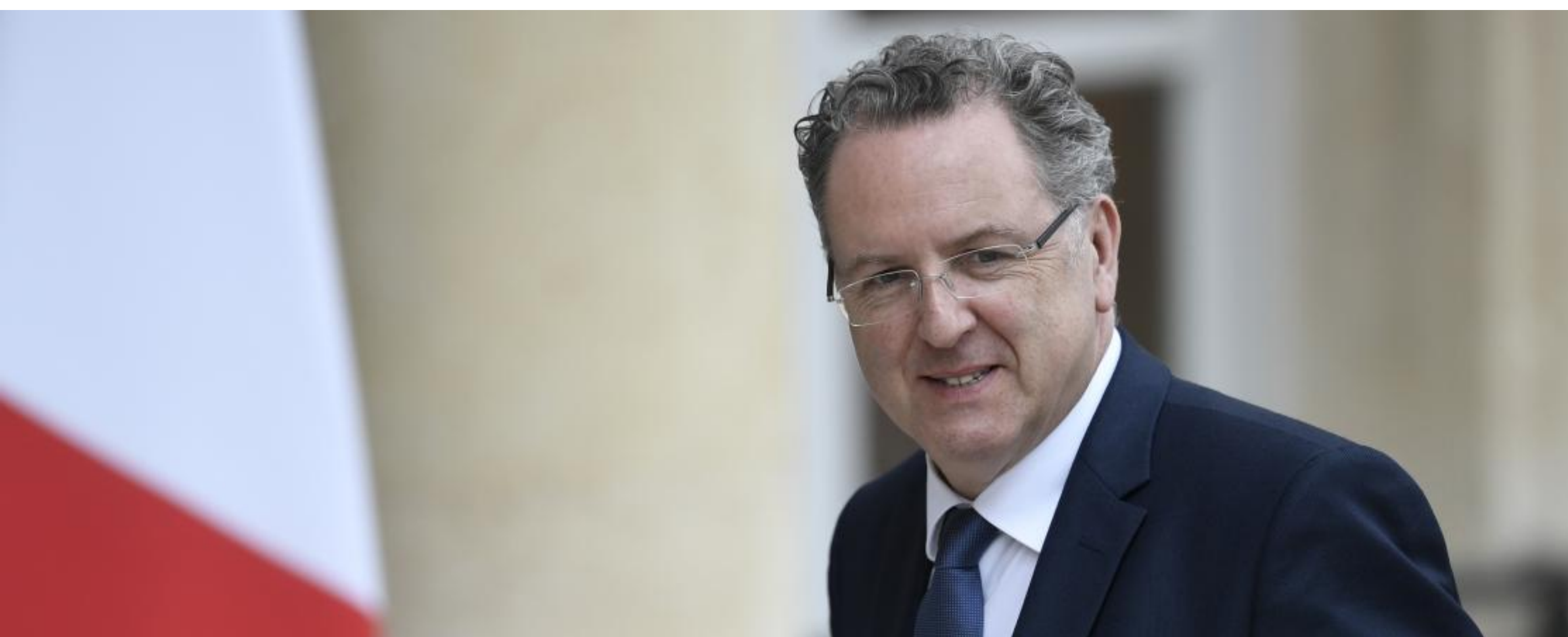
Richard Ferrand, ministre de la Cohésion des territoires, le 24 mai 2017, sur le perron de l'Élysée à Paris.

Selon "Le Canard enchaîné", les Mutuelles de Bretagne ont choisi de louer un local à une société immobilière appartenant à la compagne de celui qui allait devenir ministre de la Cohésion des territoires, alors que ce dernier était directeur général de la structure mutualiste.